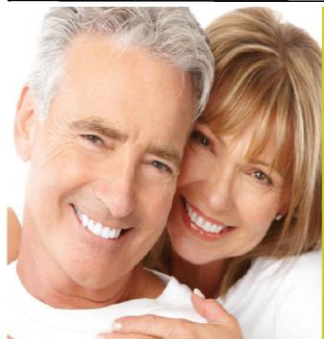
De Zwolse Tippielaars

Kamperstraat 6-8, 8011 LM Zwolle Tel. 038 - 421 58 98 Fax 038 - 422 20 86 Geerdinksweg 137-9, 7555 DL Hengelo Tel. 074 - 259 37 47 Fax 074 - 259 37 48