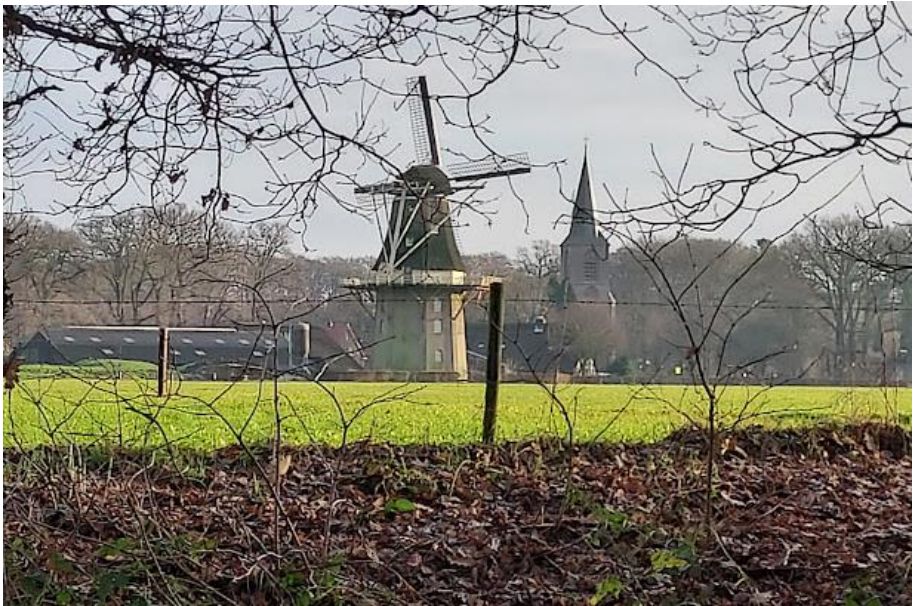
Vergezicht op het dorp Vilsteren.